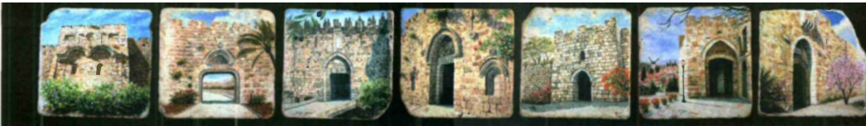
32 ירושלים שלי אייר, תשע"א 2011