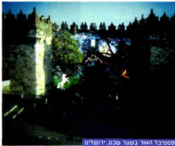
פסטיבל האור בשער שכם, ירושלים