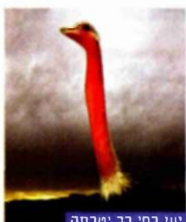
עילום שי קסבה